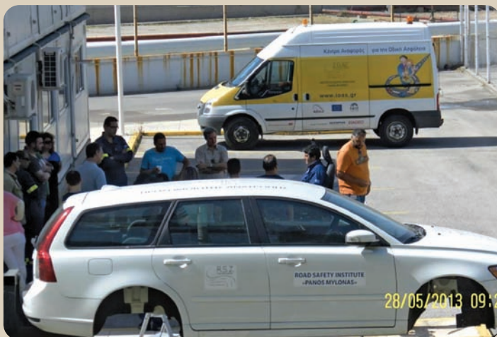
Επιμέλεια ύλης: Ευγένιος Πετούμενος, Δημιουργικό-Παρουσίαση: Γιάννης Παρασκευάς