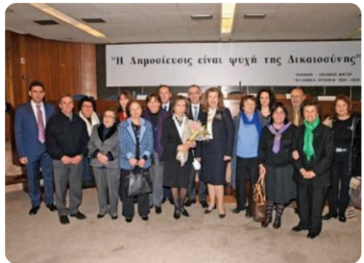
Πανεπιστημίου Αθηνών (8 Μαρτίου 2011, αίθουσα της ΕΣΗΕΑ).